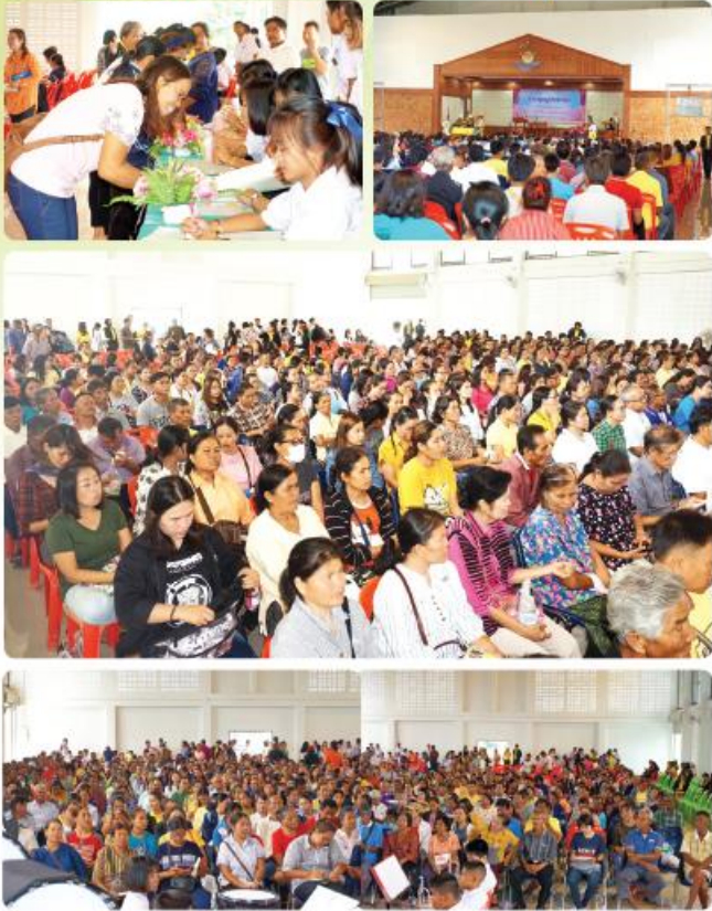
• จัดประชุมร่วมกับชุมชน •