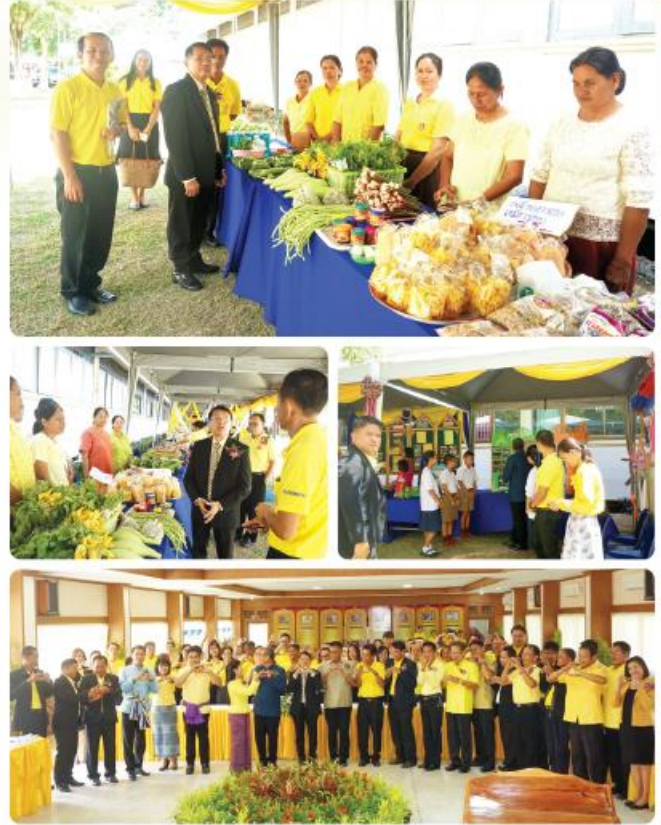
• ชุมชนร่วมแสดงผลงาน ในกิจกรรมต่างๆ ของโรงเรียน •