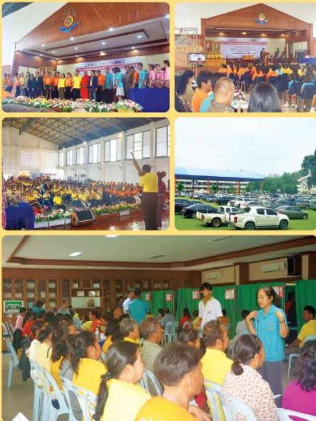
• บริการตรวจมะเร็งท่อน้ำดี จังหวัดร้อยเอ็ด •